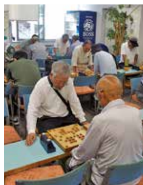
次の手を考えています