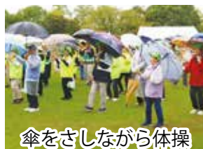
傘をさしながら体操