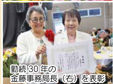
勤続30年の 金藤事務局長（右）を表彰