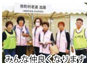
みんな仲良くなります