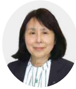
愛知県老人クラブ連合会