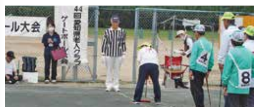
よく狙って最初の一打