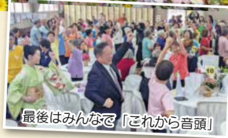
最後はみんなで「これから音頭」