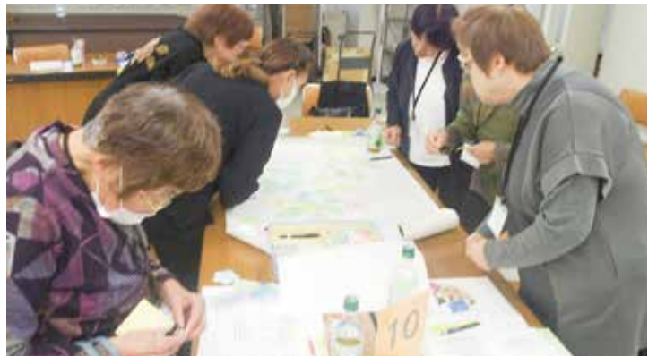
ワークショップを通して様々な意見が出ました

その後、ワークショップでは、すでに取り組んでいる事業と、新しく取り組みたいアイデアを付箋に書き、他のグループがコメントや、いいね!シールを貼り、楽しめる活動を発表しました。