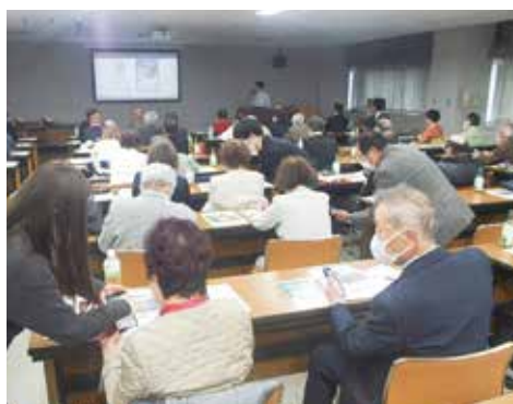
スマホを使った防災対策を学ぶ

2月13日(木) 高齢者相互支援活動研修会を開催し、22市町59名が参加しました。 2地区のモデル市町から事例発表があり、津島市ではeスポーツ大会を年2回開催するため、まずは単位クラブから普及を目指し、市老連や校区でデモンストレーションの体験会を実施しました。豊山町ではクラブがない地区