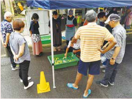
子ども会と共同で開催している七夕祭り