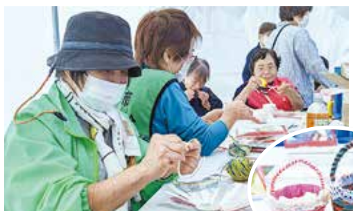
紙コップと毛糸で作る かわいい小さなカゴ作品