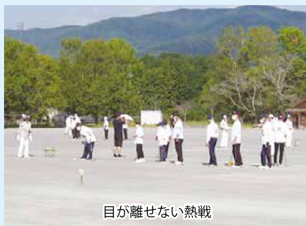
目が離せない熱戦

上位入賞チームは、2024年10月に鳥取県で開催される第36回全国健康福祉祭とっとり大会(ねんりんピックはばたけ鳥取2024)の出場候補になります。