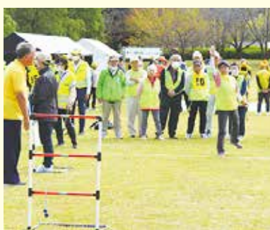
【愛知県老人クラブ連合会】

ヒモでつながっているゴムボールをハシゴ（ラダー）に向かって投げ、1、2、3点とポイントが表示されたラダーに引っ掛けて得点を競うゲーム。