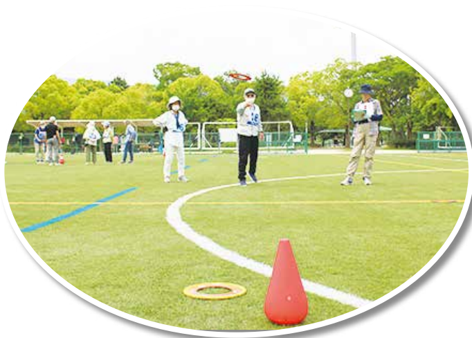
【兵庫県】芦屋市老人クラブ連合会