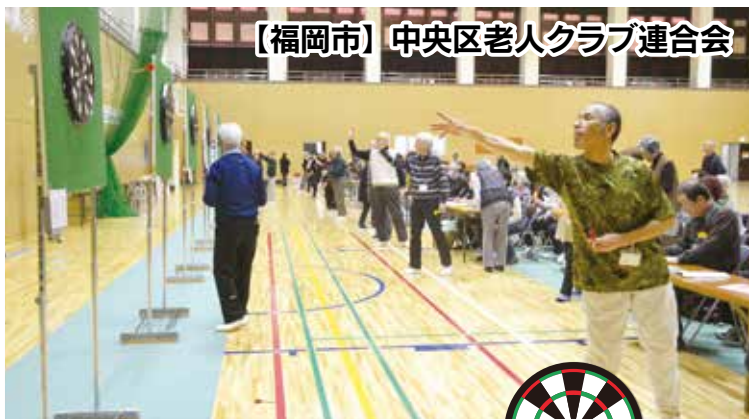
【福岡市】中央区老人クラブ連合会