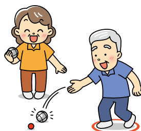
【佐賀県】鳥栖市老人クラブ連合会

ソフトダーツは、矢の先端がプラスチック製で安全性に配慮されています。得点は迅速に暗算するため頭の体操にもなります。集中力を養うことができるため認知症予防にもなります。合計得点を競う「カウント・アップ」、前競技者の得点を上回り最後まで勝ち残る「アンダー・ザ・ハット」の2種目を行い楽しんでいます。