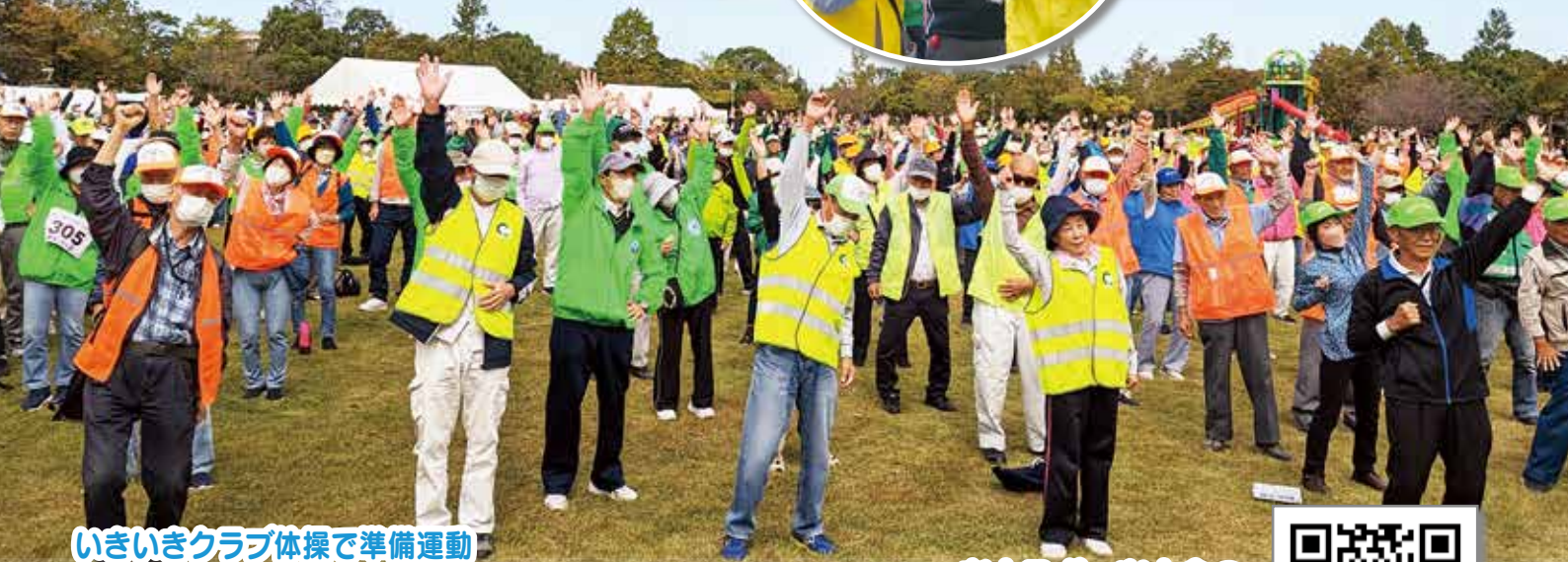
いきいきクラブ体操で準備運動