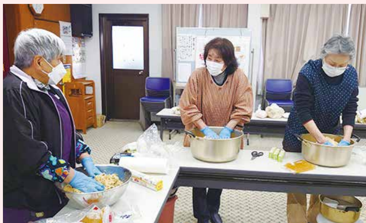
子ども会の保護者も参加し会員が手本となり味噌作り体験をしています

クリスマス、餅つきなど、近年、子どもたちが日本伝統の季節の行事にふれあう機会が減少しているため、実際に体験してもらっています。子どもたちは新しい体験の数々に目を輝かせながら楽しんでいきます。 また季節のイベントのほか、未就学児を中心とした子どもたちと味噌作り体験を行っています。事前に参加希望を地域住民から募り、参加人数を把握した上で、高齢者クラブで材料を調達し、子どもたちとの調理を行います。火を使わないた