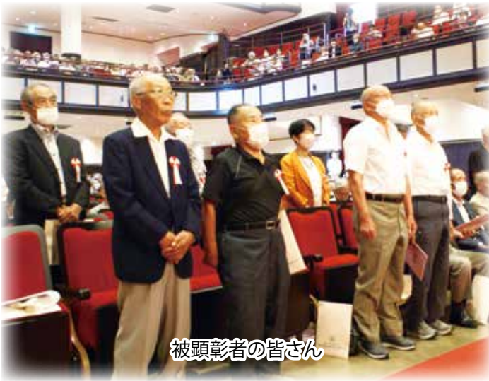
被顕彰者の皆さん

第1部では、多年にわたり老人福祉の増進に尽力された方々を称え、愛知県知事表彰・感謝状、愛知県老連会長表彰・感謝状の顕彰があり、続く協議では「大会決議」「大会宣言」「交通事故防止についての申し合わせ」の各案が満場一致で採決されました。