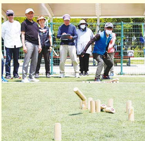
【兵庫県】芦屋市老人クラブ連合会

モルックとは、フィンランドのカレリア地方の伝統的なキックというゲームを元に開発されたスポーツです。モルックを投げて倒れた木製のピンのスキットルの内容によって得点を加算していき、先に50点になった方が勝ちとなります。50点を超えると25点へ減点されゲームは継続していくため、最後まで目が離せません。