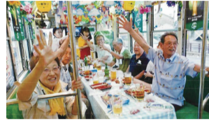
豊橋名物「納涼ビール電車」を貸し切り、楽しく交流

若竹会は、平成22年平岡区老人クラブが解散後、60代の新メンバー約50人で結成。名称も若々しく、イメージを一新しようと「若竹会」としました。ここ最近、6年連続で会員数を5名以上増やしています。80余名の会員平均年齢は75〜76歳、高齢化が進む地域にあって、自治会や子ども会と共同で盆踊りや秋祭、グラウンド・ゴルフ大会のほか、夏の貸し切り「納涼ビール電車」や日帰り旅行などクラブのイベントもオープンにし、会員以外への参加も募って、地域の人たちに親しんでいる。今年も若竹会をPRしよう、明るく楽しい若竹会をPRしています。