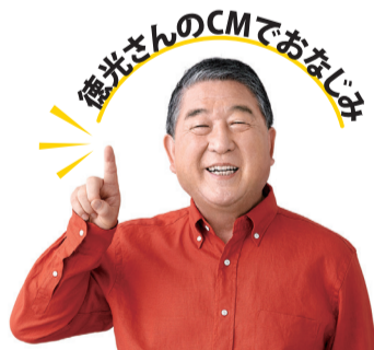
日清医療食品は医療・介護施設の食事サービスシェア No.1!

ご自宅でお食事する機会が増え、いかに手間なく美味しいものを食べるかを重視するようになった方も多いのでは?食宅便は管理栄養士監修で栄養バランスにも配慮した簡単・便利な食事宅配サービス。食宅便だからこそ味わえる豊富なメニューの数々を、ぜひお楽しみください。