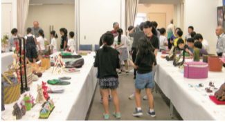
熱心に鑑賞する安城北部小学校3年生の児童と、交流。

わってどんな催し物にしようか悩みますが、みなさんの笑顔も思ったらやりがいもありま