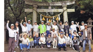
毎月熊野神社の清掃をする会員のみなさん。