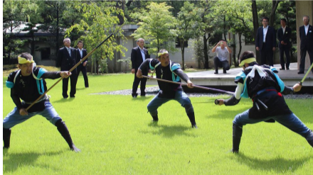
棒の手には、藤牧松藤流、天道蒲田流、井上見当流など、地区により多数の流派があります。手の演じ手による荒々しい技は、気を抜くとケガをするほど。迫真の演技に目を奪われます。

奉納する演技、見せる演技に。昭和の富国強兵の時代には、この地域の棒の手はすべて途絶えました。棒の手を演じていた長老たちの情熱と努力によって復活しました。私が教えてもらったのがその方たちです。60代、口伝で小学校3年生から20歳位までに20の型を覚え、現在、四郷地区の会員数は約240名、子どもの頃に棒の手を体験した者は3,000名を超えています。豊田市内では、正確にはわかりませんが、現在1,000名くらいはいると推測されます。そのうち、区で子どもたちへと継