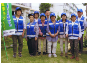
月2回、街の防犯パトロールをしています。

憩いの家。園芸部のみなさんの手でお花の絶えない憩いの家。園芸部のみなさんの手でお花の絶えない憩いの家。園芸部のみなさんの手でお花の絶えない憩いの家。