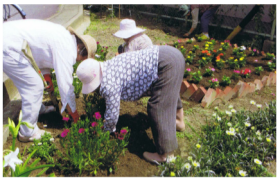
園芸部のみなさんの手でお花の絶えない憩いの家。

10年前、すべての人に開かれた魅力のある老人クラブを作ろうと、当時の会長さんを中心に、熱い思いのもと生まれ変わった「湯山クラブ」。現在会員は75名。80歳代が中心で男性32名女性49名計81名。活動的な魅力