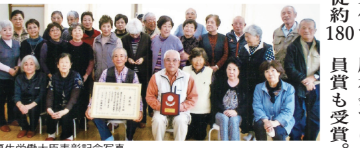
厚生労働大臣表彰記念写真