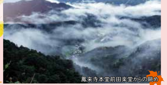
鳳来寺本堂前田楽堂からの眺め

推定樹齢800年、高さ60m、日本一を誇る杉の巨木。幹の上方で広がる枝がまるで傘をさしたように見えることから「傘すぎ」と呼ばれています。