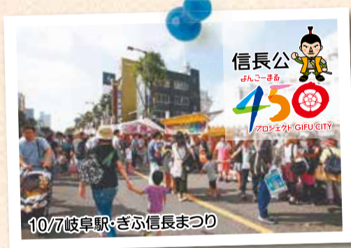
10/7岐阜駅・ぎふ信長まつり