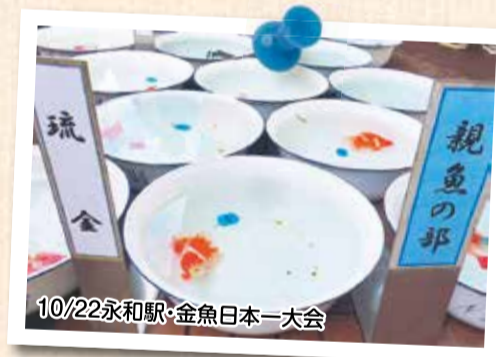
10/22永和駅・金魚日本一大会