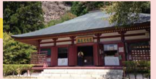
大河ドラマゆかりの地

徳川家光公によって慶安4年に建立。日光・久能山とともに日本三東照宮と称されます。国の重要文化財。