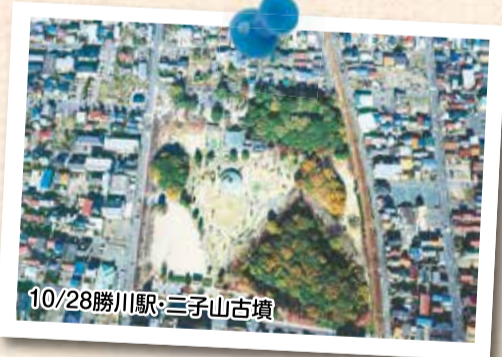
10/28勝川駅・三子山古墳